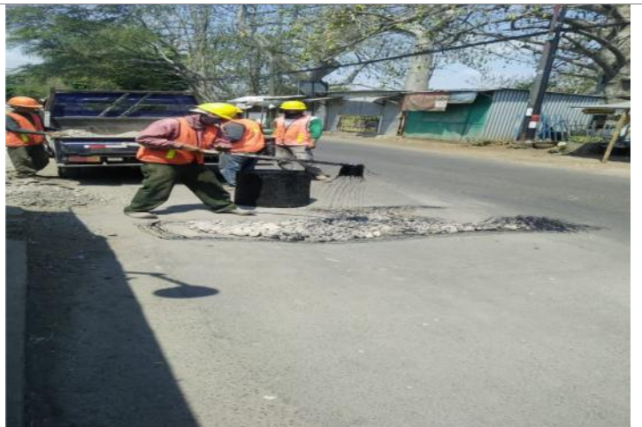
TAHAP-3 : PEMASANGAN BATU SPLIT LALU DIPADATKAN KEMUDIAN PEMASANGAN SCREED COAT / TEACK COAT