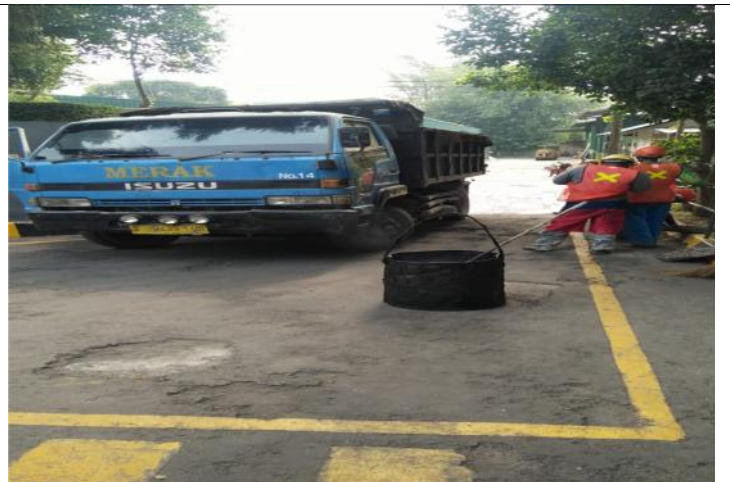
TAHAP-4 : PEMASANGAN SCREED COAT / PRIMER KEMUDIAN DI APLIKASIKAN ASPHALT HOMIX 2CM S.D 3CM