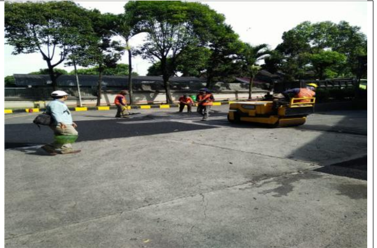
TAHAP-5 : PENGAPLIKASIAN PEMADATAN SECARA MENYELURUH DENGAN MESIN WALLS / MESIN BABY ROLLER