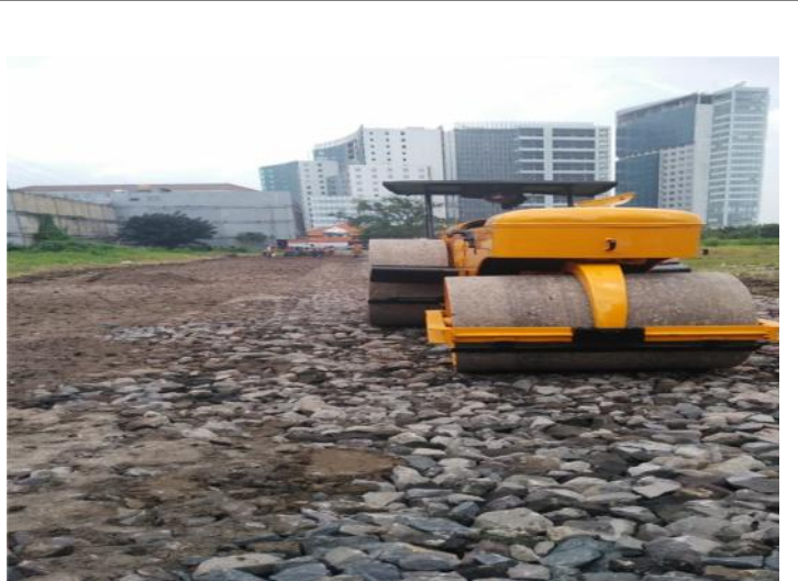
TAHAP-2 : PEMASANGAN BATU MAKADAM LALU DIPADATKAN SESUAI LEVELLING / ELEFASI YANG DITENTUKAN SHOP DRAWING