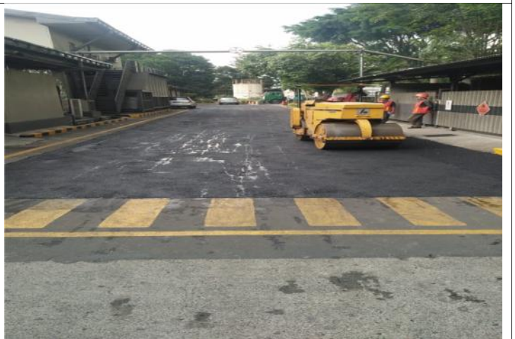
TAHAP-5 : PENGAPLIKASIAN PEMADATAN SECARA MENYELURUH DENGAN MESIN WALLS / MESIN BABY ROLLER