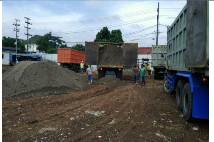
TAHAP-1 : TAHAP PERSIAPAN REPAIR EKSISTING DAN PENGURUKAN SIRTU BARU SERTA DIPADATKAN