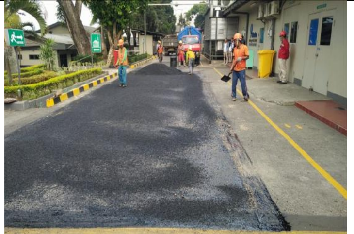
TAHAP-4 : PEMASANGAN SCREED COAT / PRIMER KEMUDIAN DI APLIKASIKAN ASPHALT HOMIX 2CM S.D 3CM