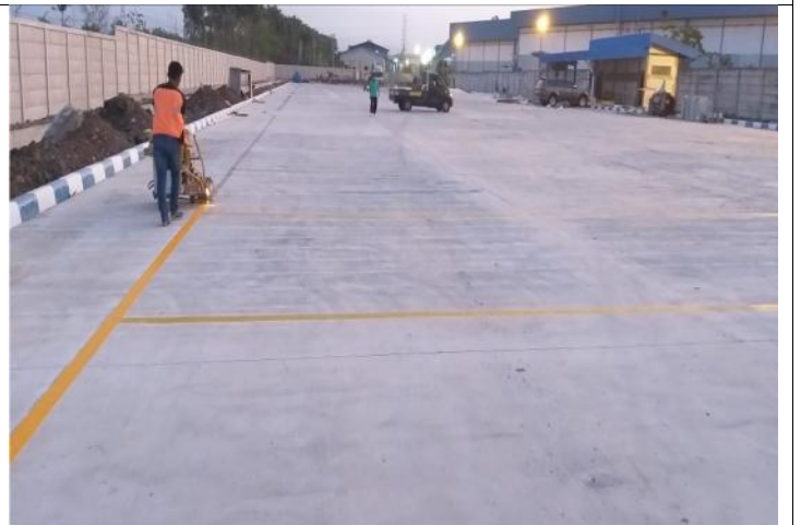
BIDANG LAINNYA : PEMASANGAN PAVING DENGAN MUTU BETEON MENGIKUTI SESUAI KEBUTUHAN USER & PENGECATAN MARKA JALAN