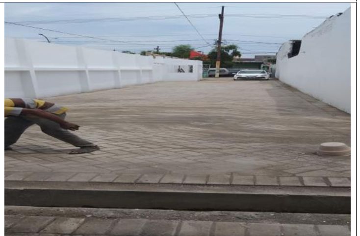
BIDANG LAINNYA : PEMASANGAN PAVING DENGAN MUTU BETEON MENGIKUTI SESUAI KEBUTUHAN USER