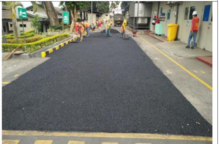
TAHAP-4 : PEMASANGAN SCREED COAT / PRIMER KEMUDIAN DI APLIKASIKAN ASPHALT HOMIX 2CM S.D 3CM