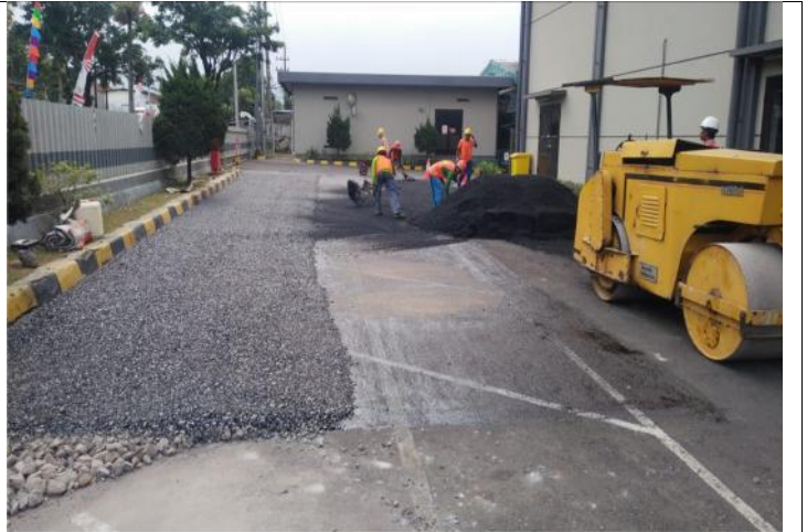
TAHAP-4 : PEMASANGAN SCREED COAT / PRIMER KEMUDIAN DI APLIKASIKAN ASPHALT HOMIX 2CM S.D 3CM